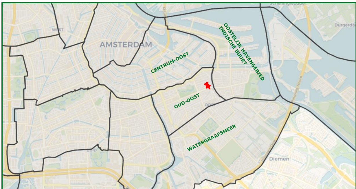
Figuur 3: Gebieden rondom locatie vereniging

De vereniging is een multiculturele organisatie die een weerspiegeling is van de samenleving. De bezoekers van de vereniging bestaan uit mensen met verschillende achtergronden. De vereniging is een plek waar kinderen, jongeren en ouderen elkaar kunnen ontmoeten. Deze bezoekers doen mee aan activiteiten die de vereniging organiseert. De activiteiten die georganiseerd worden, zijn in de basis gericht vanuit islamitische oogpunt. Daarnaast organiseren we als vereniging ook educatieve, maatschappelijke en sociale activiteiten. De vereniging wordt dagelijks druk bezocht. In de afgelopen jaren hebben we gemerkt dat de gemeenschap is gegroeid. De bezoekers zijn voornamelijk woonachtig in de in Amsterdam-Oost. Een groot deel komt ook uit Amsterdam-Zuid, Amsterdam-Zuidoost, Amsterdam-Noord en Amsterdam-Zuid Een ander deel komt zelfs vanuit buiten Amsterdam.