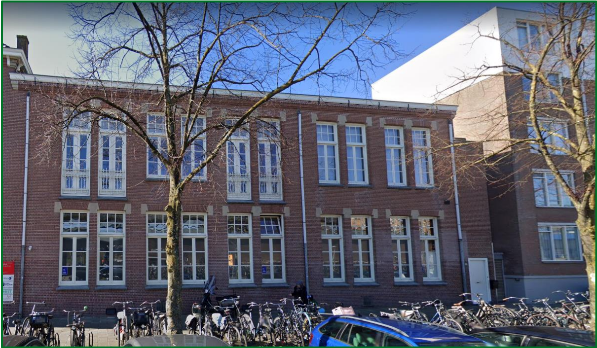
Figuur 1: Gebouw vereniging Al-Karama