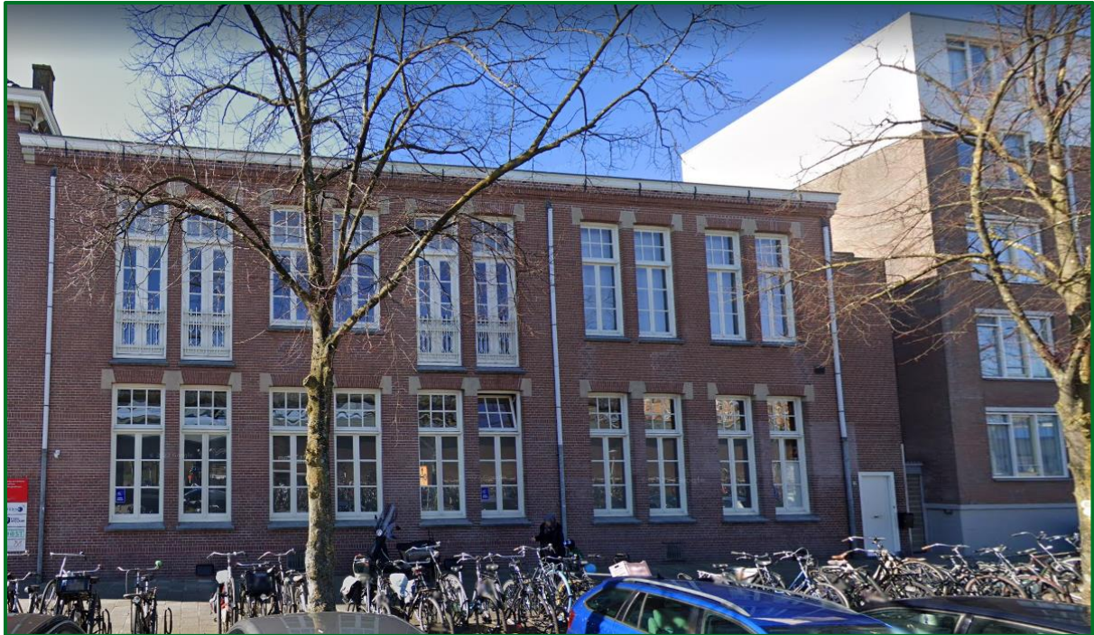
Figuur 1: Pand vereniging Al Karama